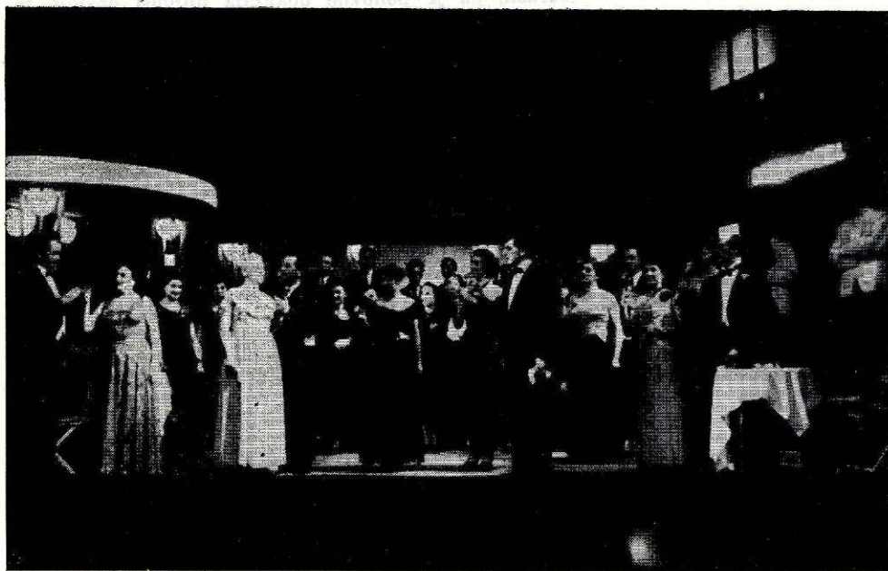
Prizor iz uprizoritve operete „Melodije srca“ na jeseniškem odru

Kvaliteten program, ki bo zahteval mnogo napora od celotnega gledališkega kolektiva, bo vsekakor zadovoljil tudi publiko, ki bo, upajmo vsaj, uspešneje in zadovoljiveje stopila skupno z gledališčem svoj prvi korak v drugo desetletje delovanja jeseniškega gledališča.