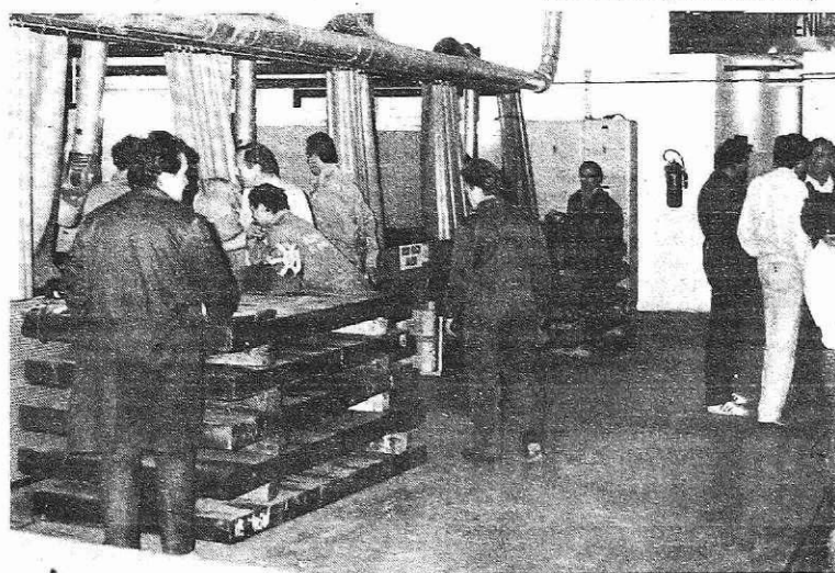
S tekmovanja varilcev v razvojnem oddelku v obratu Elektrode (S. Kokalj)